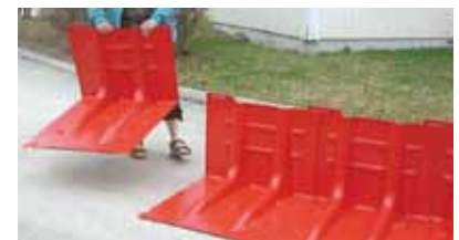
ボックスウォールを背後から見て左から右に並べる